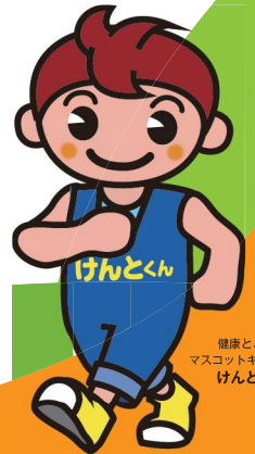
健康とよはし マスコットキャラクター けんとかん