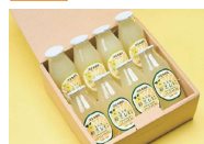
初恋レモン 飲み比べセット